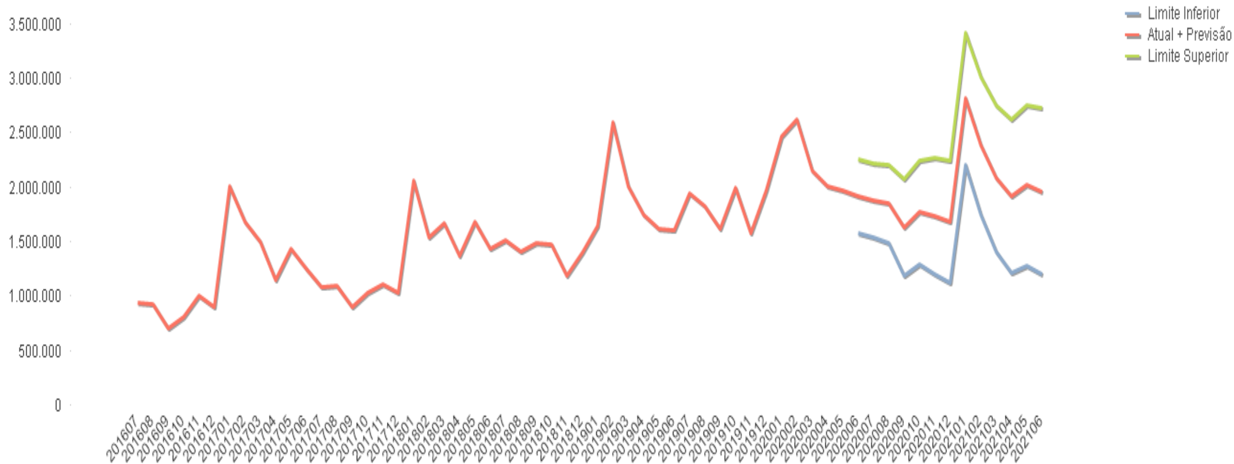
Série Histórica da Quantidade de Contratos Averbados